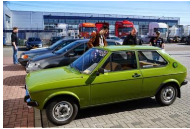
Foto-impressie ACI sleuteldag 2015 Zwolle